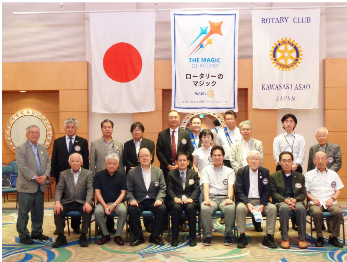
写真: 蓬田 忠 委員長