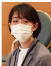
伊比 安理 様