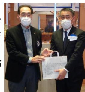
卓話を有難うございました。