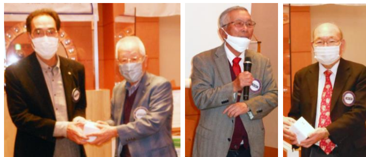
長寿の表彰を受ける会員

3. 地区ローターアクト学友会より、学友会行事『難民問題について考える』のご案内が届いております。12月18日(日) 14:30～16:45 さくらリビング第1研修室 登録料,2,000円