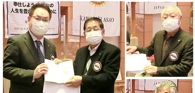
米山功労者への感謝状贈呈

3. 川崎中央RCより、『第1・第2・第3合同IM』開催に際してのお願いと登録料納入のお願いが届いております。