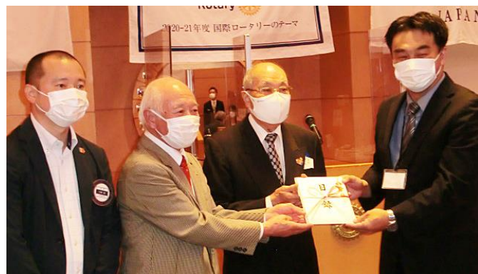
川崎幹事 蓬田会長 三富G補佐 依理事