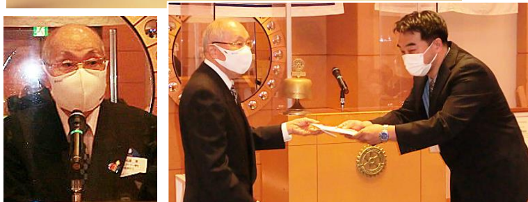
三富ガバナー補佐より依理事へ支援金の目録が渡されました。