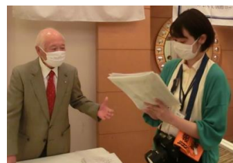
タウンニュースの取材