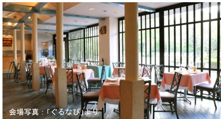
会場写真:「ぐるなび」より