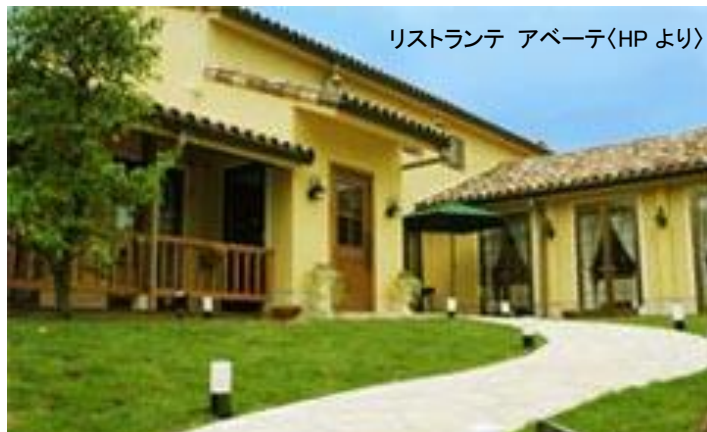
レストランテ アペーテ