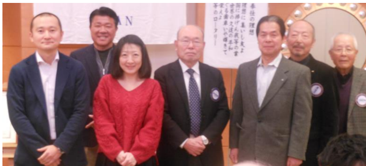
2月に記念日を迎えた会員の皆様