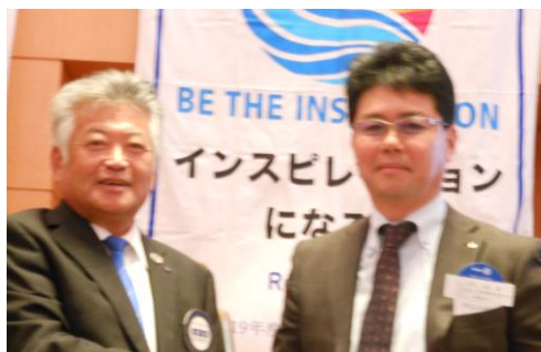
有難うございました。

つたない卓話ではございますが、今後ともロータリー財団へのご寄付を宜しくお願い致します。