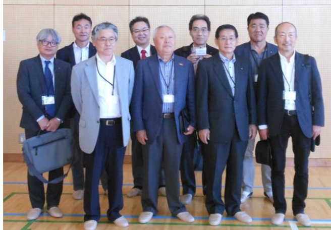
柿生中学校卒業生の会員

柿生中学校1年生全員が集まった体育館で、AEDの寄付目録が生徒代表に渡され、生徒からはお礼と感謝の言葉をいただきました。AEDはすでに学校入口に取り付けられ、カバーケースには、クラブの名前が入っていました。体育館では、1年生が使い方の講習を受け、熱心に取り組んでいました。