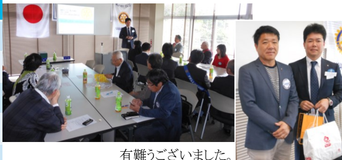
有難うございました。