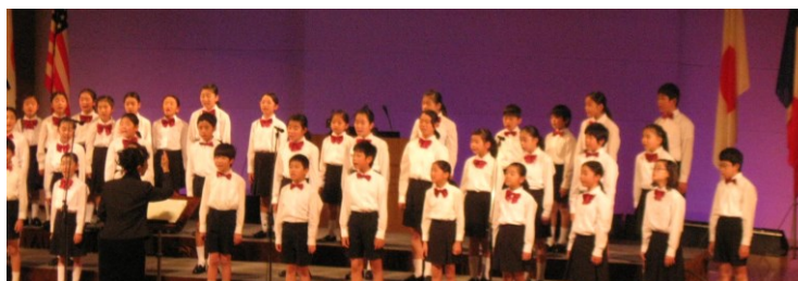
坂戸小学校合唱団の子供達によるウェルカムソング