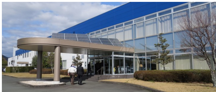
工場 液体棟 正面玄関