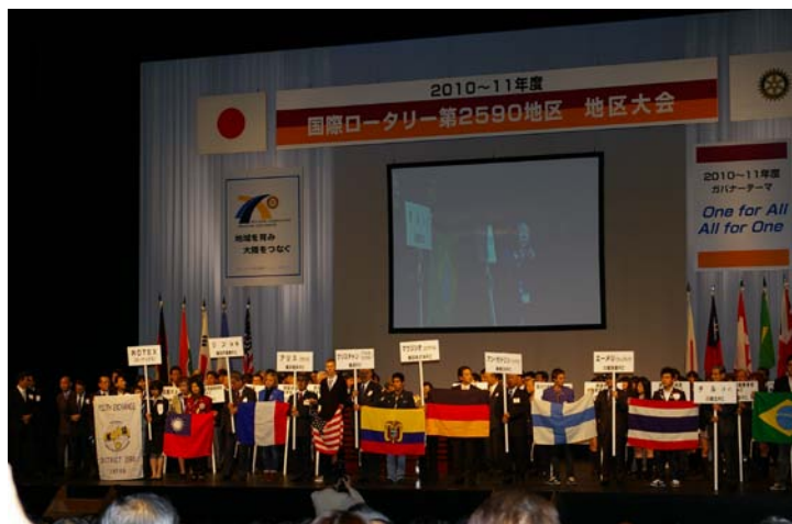
地区大会出席会員の皆さん